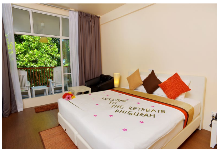
Le Shairose Deluxe si trovano in un'altra costruzione a due piani, 4 camere al piano terra e 4 al piano superiore. Ogni camera ha una veranda o terrazza e quelle al piano superiore hanno la vista verso il mare.